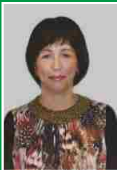
Главная медицинская сестра, председатель Совета по сестринскому делу.