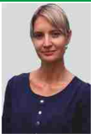
Главная акушерка, председатель Совета по акушерскому делу.

Адрес места нахождения медицинской организации: 644020, г. Омск, ул. Рождественского, 2 Сайт медицинской организации: www.roddom5-omsk.ru Электронный адрес председателя Совета: oxana.ok-golovko@yandex.ru Телефоны председателя Совета: раб. (3812) 41-43-70 моб. 8-950-333-01-09 Дата создания Совета: 12.11.1990 г. Количество сестринского персонала на 01.10.2016 г: 118 человек Количество членов ОПСА на 01.10.2016 г: 91 человек (77%)