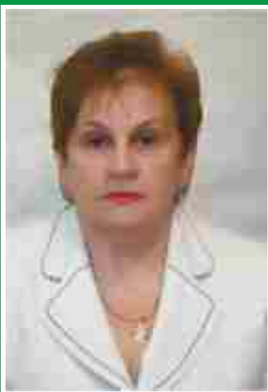
Главная медицинская сестра, председатель Совета по сестринскому делу.

Адрес места нахождения медицинской организации: 644045, г. Омск, пр. Менделеева, 17, корпус 2 Сайт медицинской организации: www.gp4omsk.ru Электронный адрес председателя Совета: gp4starmed@gmail.com Телефоны председателя Совета: раб. (3812) 60-74-00 моб. 8-950-781-90-23 Дата создания Совета: 01.10. 1973 г. Количество сестринского персонала на 01.10.2016 г: 138 человек Количество членов ОПСА на 01.10.2016 г: 85 человек (62%)