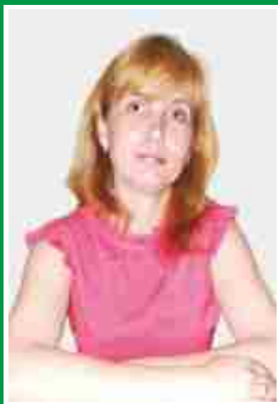
Главная медицинская сестра, председатель Совета по сестринскому делу.

Количество членов ОПСА на 01.10.2016 г: 127 человек (82%)