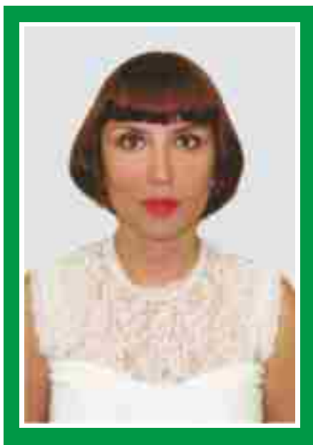
Главная медицинская сестра, председатель Совета по сестринскому делу.

Количество членов ОПСА на 01.10.2016 г: 126 человек (70%)