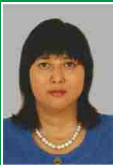
Главная медицинская сестра, председатель Совета по сестринскому делу.