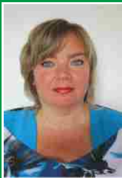
Главная медицинская сестра, председатель Совета по сестринскому делу.