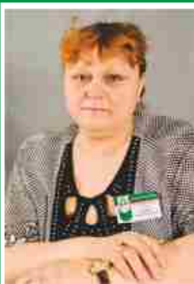
Главная медицинская сестра, председатель Совета по сестринскому делу.