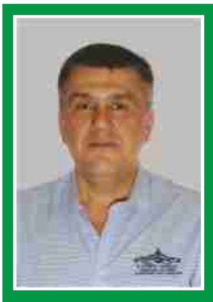
Главный медицинский брат, председатель Совета по сестринскому делу.

Количество членов ОПСА на 01.10.2016 г: 139 человек (55%)