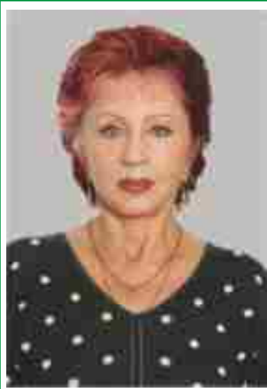
Главная медицинская сестра, председатель Совета по сестринскому делу.

Количество членов ОПСА на 01.10.2016 г: 104 человека (61%)