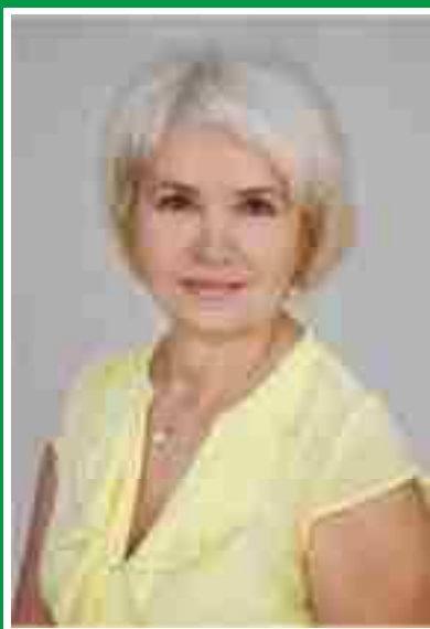
Главная медицинская сестра, председатель Совета по сестринскому делу.