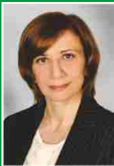
Главная медицинская сестра, председатель Совета по сестринскому делу.