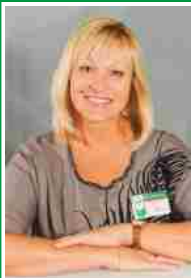
Заместитель главного врача по работе с сестринским персоналом, председатель Совета по сестринскому делу.