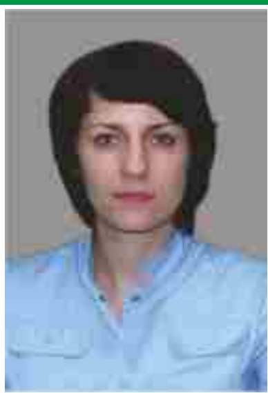
Старшая медицинская сестра, Председатель Совета по сестринскому делу.

Адрес места нахождения медицинской организации: 644073, г. Омск, ул. 2-я Любинская, 2 Сайт медицинской организации: www.detosan2.ru Электронный адрес председателя Совета: dvugrosheva.nata@mail.ru Телефоны председателя Совета: раб. (3812) 710-730 моб. 8-913-142-25-31 Дата создания Совета: 14.05.2002 г. Количество сестринского персонала на 01.10.2016 г: 14 человек Количество членов ОПСА на 01.10.2016 г: 14 человек (100%)