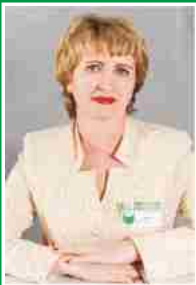
Главная медицинская сестра, председатель Совета по сестринскому делу.