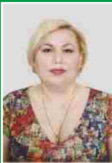
Главная медицинская сестра, председатель Совета по сестринскому делу.