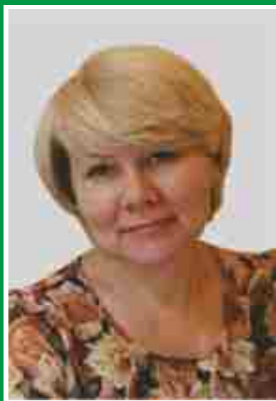
Главная акушерка, председатель Совета по акушерскому делу.