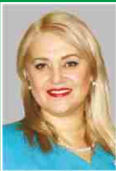
Главная акушерка, председатель Совета по акушерскому делу.

Количество членов ОПСА на 01.10.2016 г: 95 человек (60%)