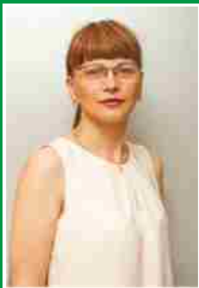
Главная медицинская сестра, председатель Совета по сестринскому делу.