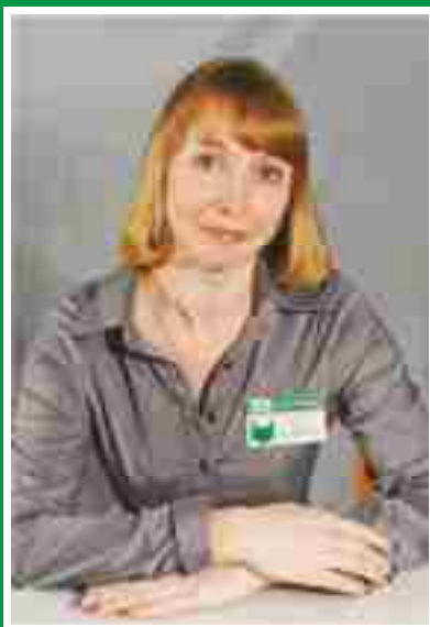
Главная медицинская сестра, председатель Совета по сестринскому делу.

Количество членов ОПСА на 01.10.2016 г: 158 человек (75%)