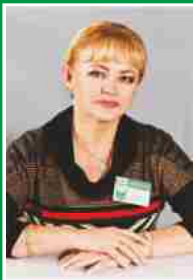
Главная медицинская сестра, председатель Совета по сестринскому делу.