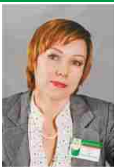
Главная медицинская сестра, председатель Совета по сестринскому делу.

Адрес места нахождения медицинской организации: 644009, г. Омск, ул. 10 лет Октября, 179 Сайт медицинской организации: www.omskbusoogp2.ru Электронный адрес председателя Совета: koх.61@mail.ru Телефоны председателя Совета: раб. (3812) 36-98-81 моб. 8-908-791-70-02 Дата создания Совета: 15.07.1984 г. Количество сестринского персонала на 01.10.2016 г: 86 человек Количество членов ОПСА на 01.10.2016 г: 62 человека (72%)