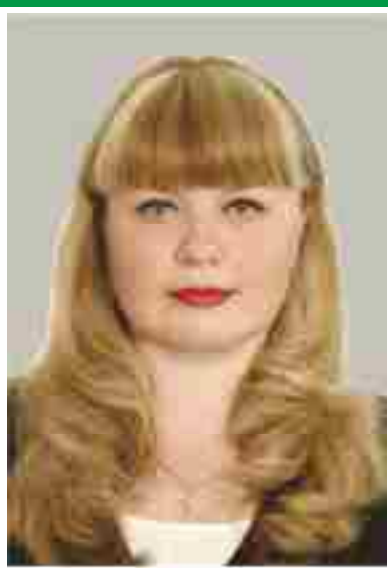
Главная медицинская сестра, председатель Совета по сестринскому делу.

Количество членов ОПСА на 01.10.2016 г: 33 человека (92%)