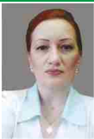
Главная медицинская сестра, председатель Совета по сестринскому делу.

Адрес места нахождения медицинской организации: 644088, г. Омск, ул. Энтузиастов, 9 Сайт медицинской организации: www.dgp1.ru Электронный адрес председателя Совета: sveta.ru08@list.ru Телефоны председателя Совета: раб. (3812) 22-35-15 моб. 8-908-311-14-08, 8-913-682-73-16 Дата создания Совета: 11.01.1992 г. Количество сестринского персонала на 01.10.2016 г: 102 человека Количество членов ОПСА на 01.10.2016 г: 63 человека (62%)