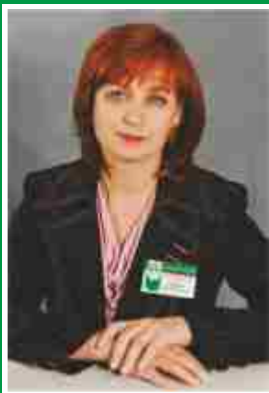
Главная акушерка, председатель Совета по акушерскому делу.