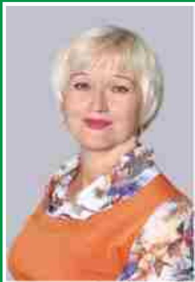
Главная медицинская сестра, председатель Совета по сестринскому делу.