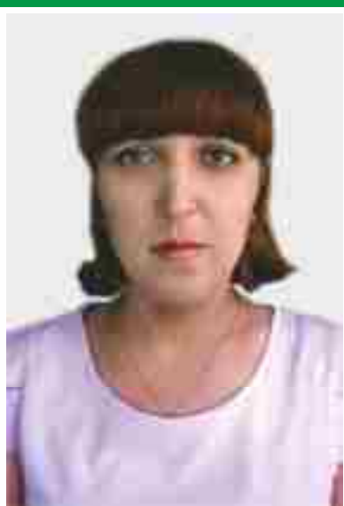
Главная медицинская сестра, председатель Совета по сестринскому делу.

Адрес места нахождения медицинской организации: 644901, г. Омск, мкр. Береговой, ул. 1 Осенняя, 79 Сайт медицинской организации: www.g66.med55.pф Электронный адрес председателя Совета: khamval@rambler.ru Телефоны председателя Совета: раб. (3812) 98-17-28 моб. 8-904-580-13-39 Дата создания Совета: 15.10.2001 г. Количество сестринского персонала на 01.10.2016 г: 67 человек Количество членов ОПСА на 01.10.2016 г: 66 человек (99%)